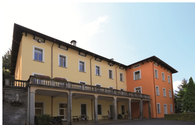
Residenza Integrata IL DESERTO di Chiavenna (SO)